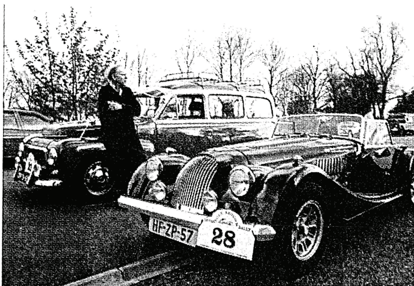
Bij Fraamklap rust een deelnemer even uit.

Organisatoren van deze rally zijn Fedde Dokter en Tiddo Havinga. Zij deden vorig jaar mee aan de beaujolaisrace met een Peugeot 205 uit 1955 en tijdens een reünie, begin dit jaar, ontstond het idee om een rally door de provincie te houden. „Groningen kent zulke wonderschone landschappen. Bovendien kom je zo op plekjes die je niet kent. Soms ken je de weg in het buitenland beter dan in je eigen regio”, weet de in Zuidwolde woonachtige Dokter. Om ook een typisch Gronings fenomeen bij de tocht te betrekken kwamen de reünisten op het idee om de route langs huiskamerkroegen te leggen, zoals in Fraamklap, Thesinge en Westerwijtwerd. Deze fungeerden als stempelposten.