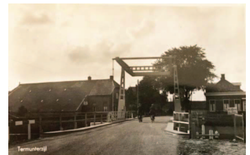
Foto 60-er jaren, schuur van de boerderij (links op foto) aan de Mello Coendersbuurt stond vol met de mooiste klassieke automobielen. Was particulier eigendom. Boerderij in 2008 afgebroken voor nieuwbouwwoningen recht t.o. Theeschenkerij Teetied, Mello Coendersbuurt 2. Bezoek en GKR stempelpost in 1998.