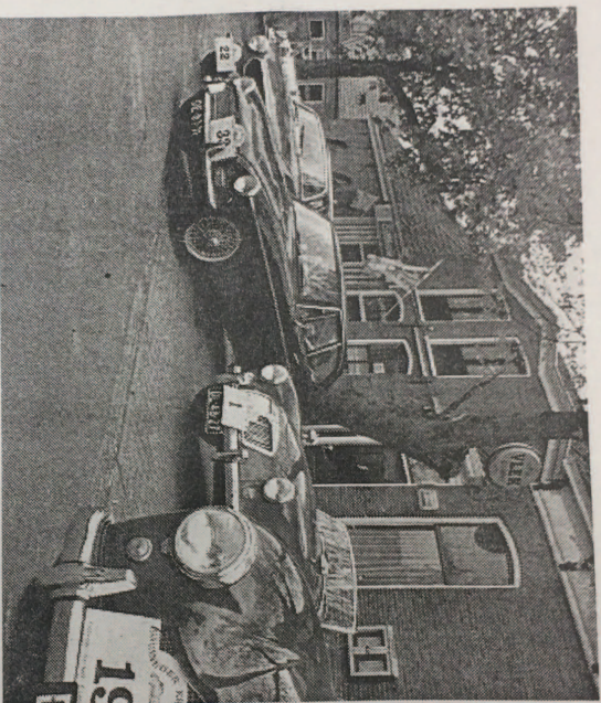
■ Fraaie automobielen voor café Vaatstra in Zuidwolde, de start- en finishplaats voor het concours d'élégance langs authentieke Groninger kroegen.